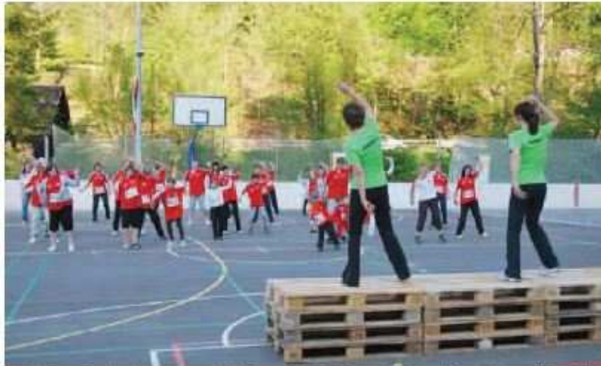
L'an dernier, la manifestation avait commencé par un événement collectif et filmé. Cette année, le concept évolue et devient une flashmob filmée, qui s'apparente davantage à une chorégraphie. Ce concours oppose les communes et sera initié par la Sava à la fin du vendredi 4 mai. ...