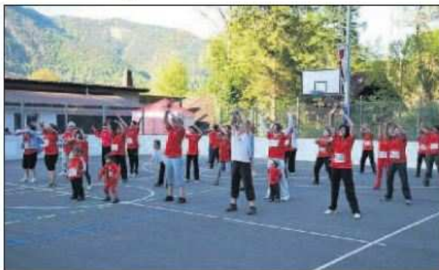
A Crémînes, la population s'est prise au jeu de La Suisse bouge depuis 2010.

Dès la première édition il y a 2 ans, qui marquait l'inauguration de la place polysportive de Crémînes, l'enthousiasme de la population de la région a été au rendez-vous. Pour preuve, l'an dernier ce ne sont pas moins de 2880 heures de sport qui ont été réalisées en 9 jours par les quelque 500 participants à la manifestation. Un record que les initiateurs, Arnaud et René Schrameck, espèrent bien voir pulvérisé cette année.