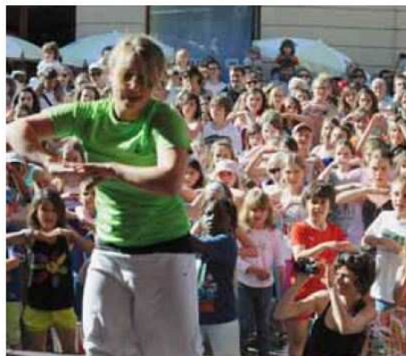
A La Neuveville, la flashmob a attiré la foule.