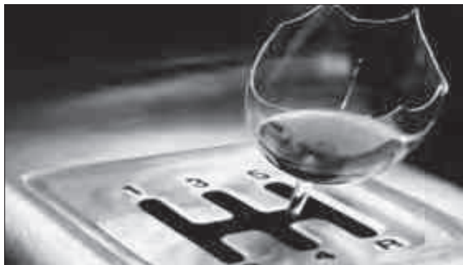
Boire ou conduire, il faut choisir.

Il y a dix ans, la limite légale du taux d'alcool admis dans la circulation routière a été abaissée de 0,8 à 0,5 pour mille. Depuis, le nombre de blessés graves et de tués dans les accidents de la route liés à l'alcool a nettement reculé. Toutefois, la consommation d'alcool continue à être responsable d'un accident grave sur dix. Une campagne du bpa et de la police sensibilise le public à cette problématique. En 2005, l'abaissement du taux limite d'alcool au volant de 0,8 à 0,5 pour mille ne se fit pas sans résistance. Mais dix ans plus tard, cette modification législative ainsi que l'introduction simultanée de la possibilité, pour la police, d'effectuer des contrôles d'alcoolémie sans indice d'ébriété ont fait leurs preuves. Le nombre de blessés graves et de tués dans les accidents liés à l'alcool a pu être davantage réduit que dans le reste de l'accidentalité. Devant ces faits, les mentalités ont commencé à évoluer. Majoritairement, la population ne considère plus que conduire en état d'ébriété est un délit mineur, mais l'appréhende pour ce qu'il est réellement: un des dangers majeurs pour la sécurité routière. L'alcool est en jeu dans quelque 10%