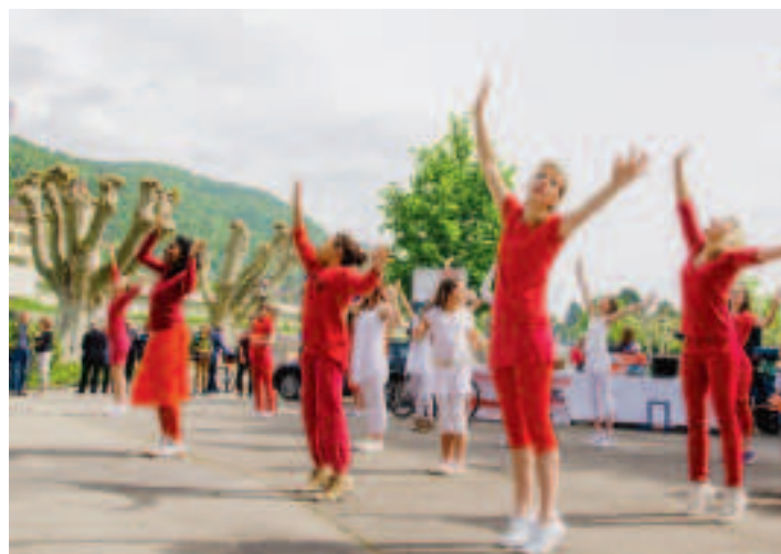
Jolie démonstration de danse de l'association «Entre racines et envol». L.VIGLINO