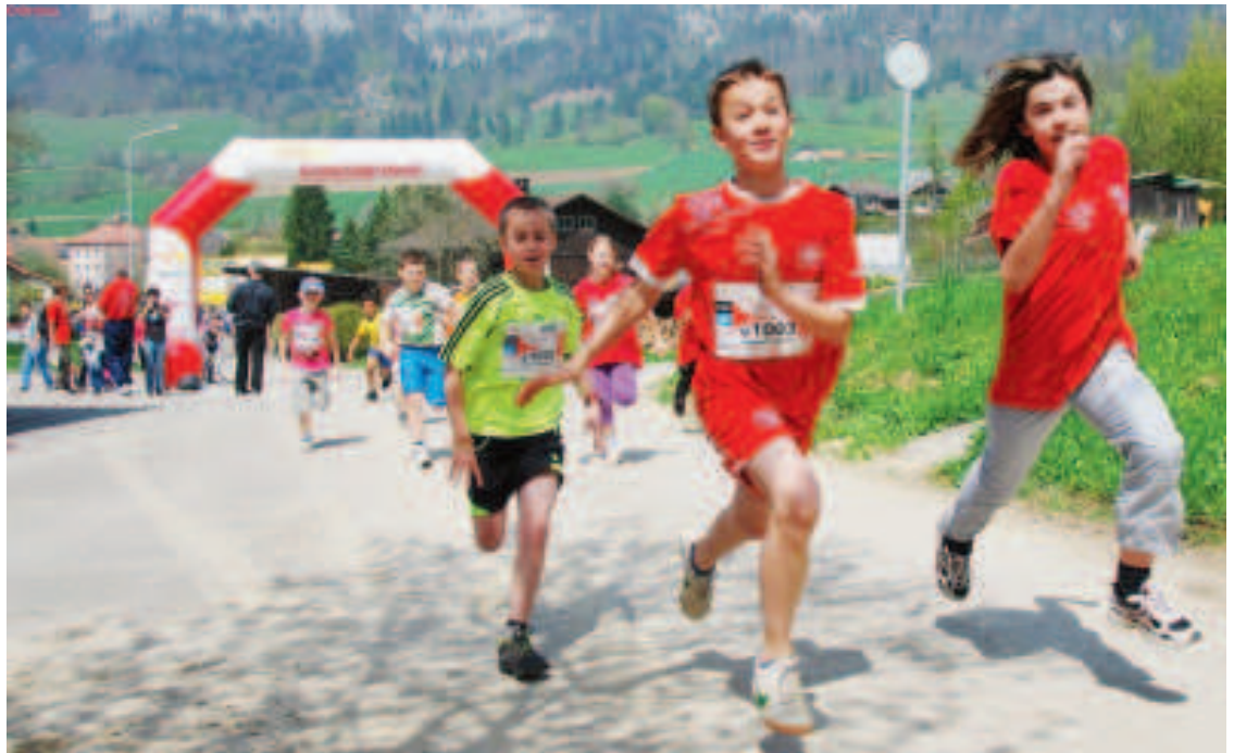
Avec la Suisse bouge, Crémines a réussi à créer une ambiance du tonnerre.

La Suisse bouge, Crémines et La Neuveville rebougent. Depuis que le concept de faire se bouger les populations, entre 150 et 200 communes de toute la Suisse participent à ce programme santé et alimentation initié par l'Office fédéral du sport. C'était en 2005, année du sport, que la Suisse s'est mise en mouvement. Le Jura bernois n'était d'ailleurs pas en reste. Mais aujourd'hui que le soufflé est un peu retombé, les deux communes du Jura bernois persistent non seulement à créer l'événement, mais encore à l'améliorer. Les activités débutent aujourd'hui 29 avril à Crémines et le 2 mai à La Neuveville. Evillard/Macolin bougera du 4 au 9 mai. Nous y reviendrons.