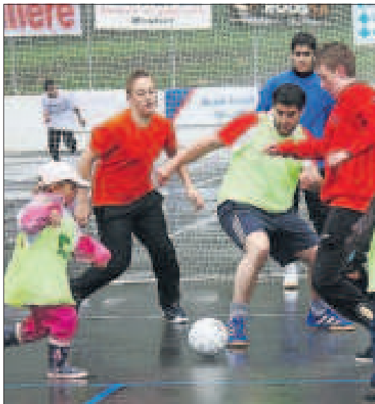
Jeunes et moins jeunes sont invités à bouger à Crémînes et La Neuveville, dès la semaine prochaine.