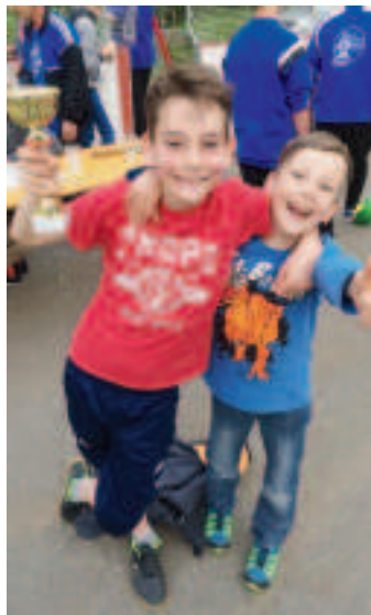
Des graines de champions fiers de leur trophée à Crémines.

Cette manifestation était cette année jumelée au marché bio. Les familles présentes au marché ont ainsi pu se laisser tenter par un peu d'exercice. Même s'il est trop