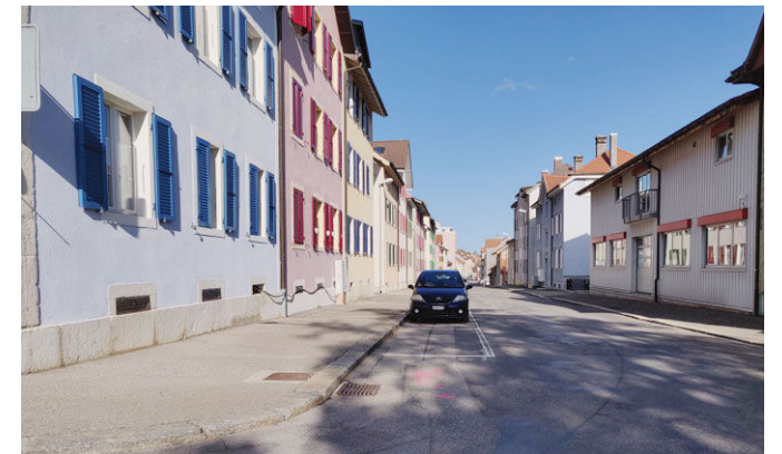
On ne roule que dans un sens à la rue de Jonchères. LDD