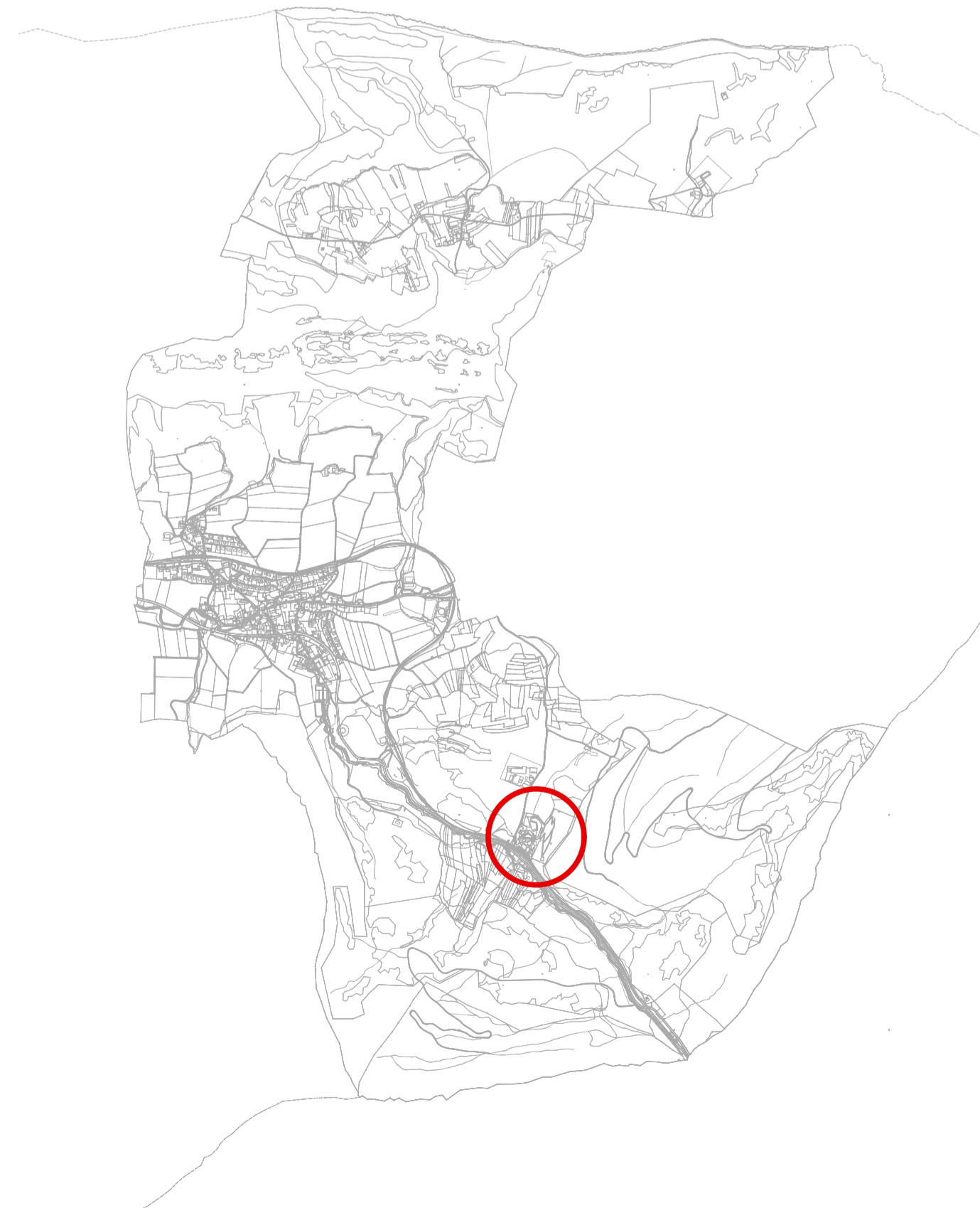
Commune de Crémines II éch.: 1:25000