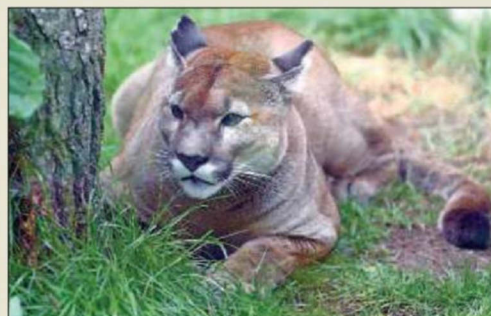
Dans son parc, l'un des pumas observe tranquillement les visiteurs.

Active au sein de l'établissement depuis plusieurs années, soit avant même la transformation du Siky Ranch en Siky Park, la soigneuse Kim Herzog était elle aussi aux anges hier. «Les félins se sont très bien acclimatés, ils sont détendus et à l'aise. Nous sommes fiers de pouvoir maintenant les présenter, eux et leur nouvel environnement, aux visiteurs.»