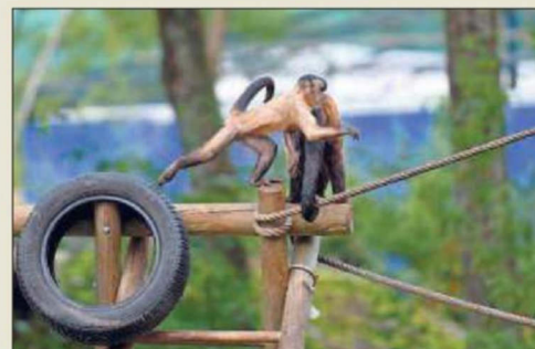
Les singes et autres bêtes exotiques ou locales sont toujours de la partie.